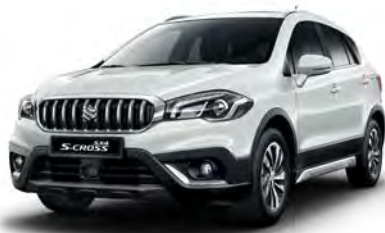
Cool White Pearl (ZNL) (1)