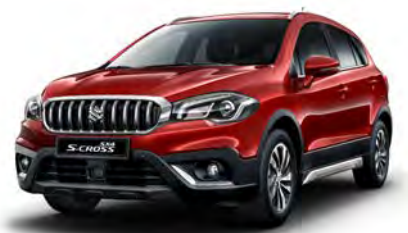
Energetic Red Pearl (ZQ5) (1)