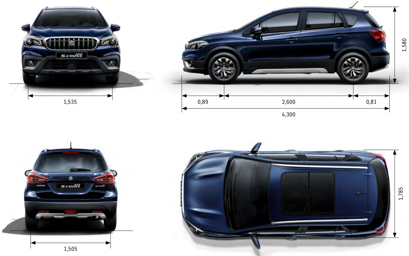
Maße in Meter