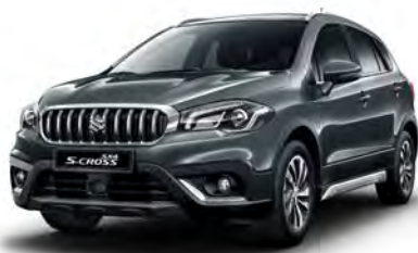
Mineral Gray 3 Metallic (ZQ6) (1)