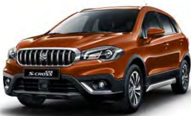
Canyon Brown Pearl Metallic (ZQ3) (1)