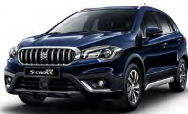
Sphere Blue Pearl (ZQ4) (1)