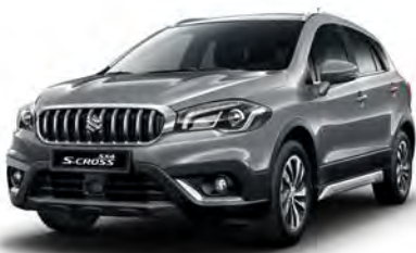
Galactic Gray Metallic (ZCD) (1)