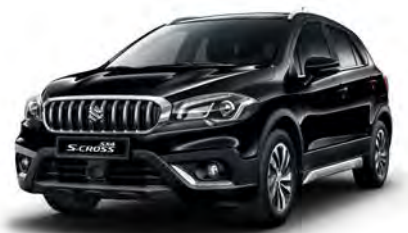
Cosmic Black Pearl Metallic (ZCE) (1)