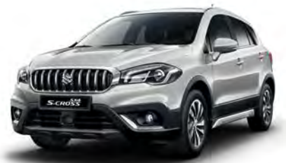
Silky Silver 2 Metallic (ZCC) (1)