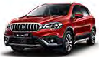
Energetic Red Pearl (ZQ5) (1)