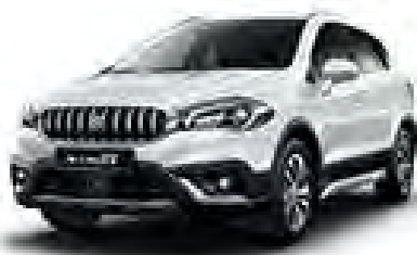
Cool White Pearl (ZNL) (1)