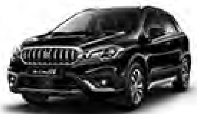
Cosmic Black Pearl Metallic (ZCE) (1)