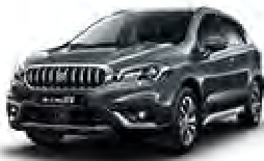
Mineral Gray 3 Metallic (ZQ6) (1)