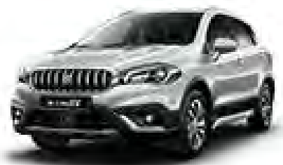
Silky Silver 2 Metallic (ZCC) (1)