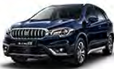
Sphere Blue Pearl (ZQ4) (1)