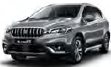
Galactic Gray Metallic (ZCD) (1)