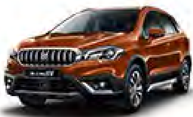
Canyon Brown Pearl Metallic (ZQ3) (1)