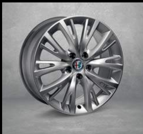
74B 17" Speiche Aluminium Felgen mit 225/45 Bereifung