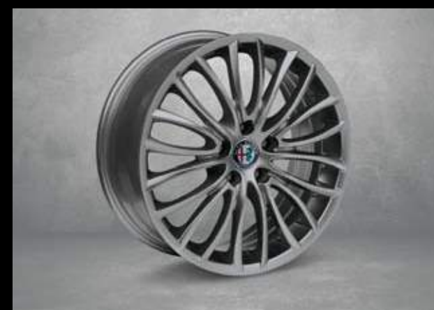
73Z* 18" Multispeichen Aluminium Felgen mit 225/45* Bereifung