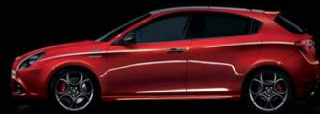
361 Rosso Competizione