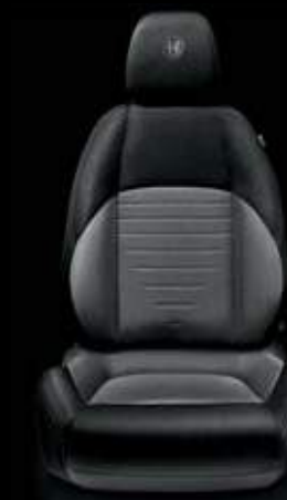
Stoff 198 Schwarz/Grau (Serie)