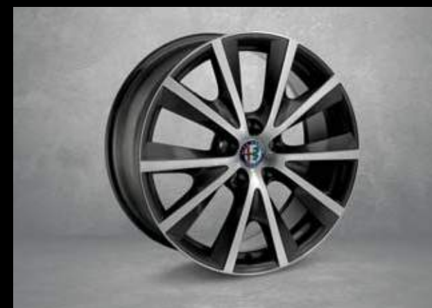
7HP 18" Speichen Chrom/Poliert Aluminium Felgen mit 225/40 Bereifung