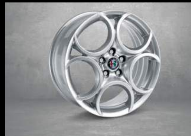
439 18" 5-Loch Aluminium Felgen mit 225/40 Bereifung