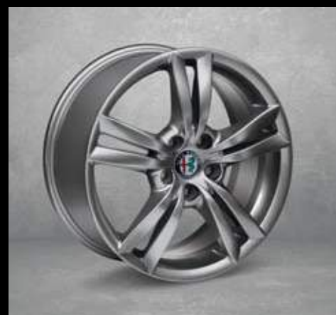
421** 17" Doppelspeichen Aluminium Felgen mit 225/45 Bereifung