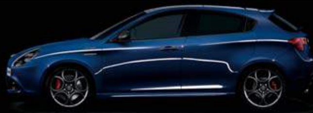
486 Blu Anodizzato