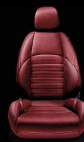
Leder 901 Rot (Option)