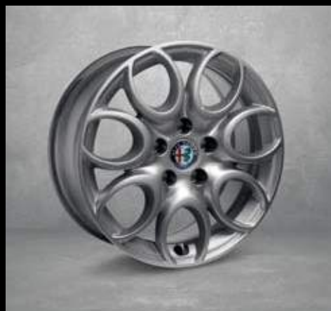
74A 16" Sieben-Loch Aluminium Felgen mit 205/55 Bereifung