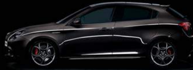
805 Nero Etna