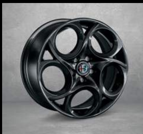
6Y8** 17" 5-Loch dunkel Aluminium Felgen mit 225/45 Bereifung