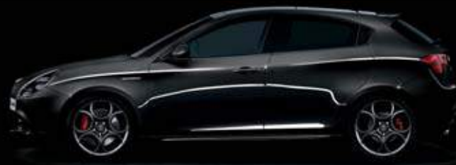
601 Nero Alfa