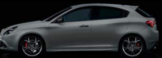
529 Grigio Magnesio