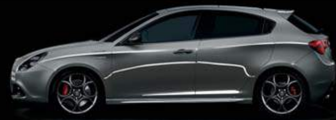
318 Grigio Stromboli