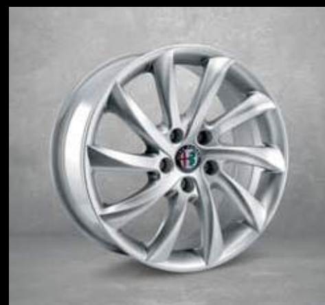
420 17" Turbina Aluminium Felgen mit 225/45 Bereifung