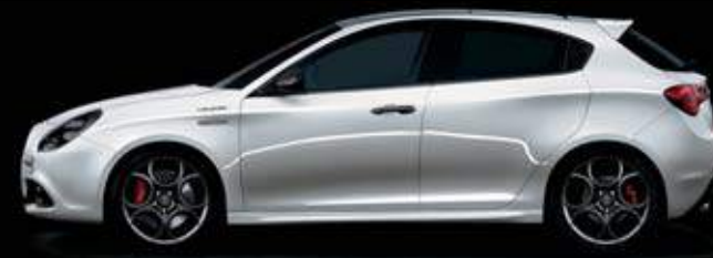
764 Perla Moonlight