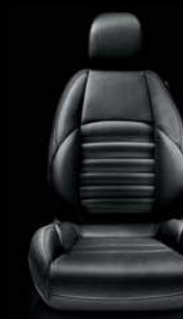
Leder 402 Schwarz (Option)