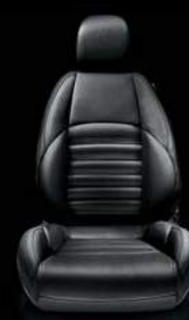
Leder 923 Schwarz (Option)