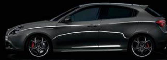
409 Grigio Lipari