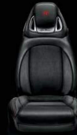
Leder/Alcantara® 323 Schwarz (Serie)