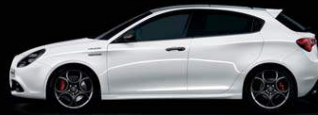
217 Bianco Alfa