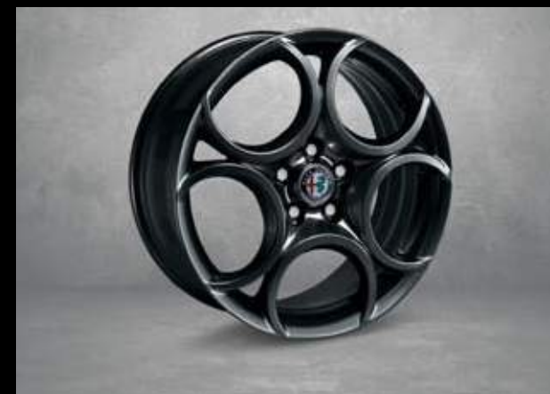
5FB 18" 5-Loch dunkel Aluminium Felgen mit 225/40 Bereifung