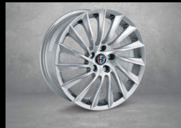
435 18" Turbina Aluminium Felgen mit 225/40 Bereifung