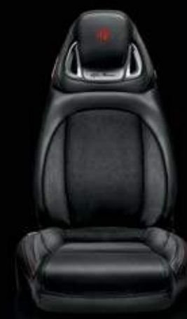
Leder/Alcantara® 323 Schwarz (Serie)