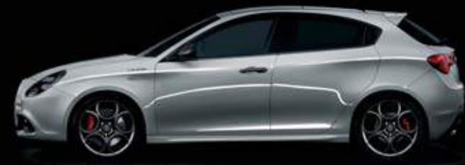
620 Grigio Silverstone