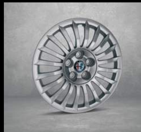
404 16" Radzierkappe mit 205/55 Bereifung