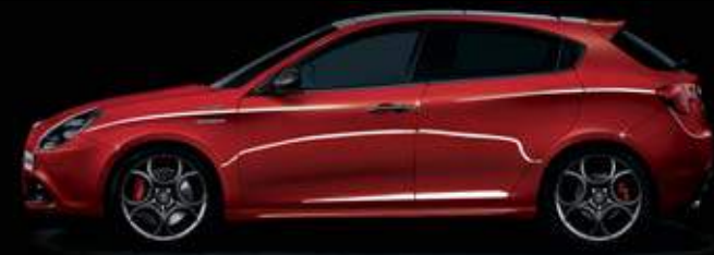
414 Rosso Alfa