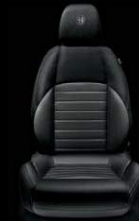
Stoff 123 Schwarz (Serie)