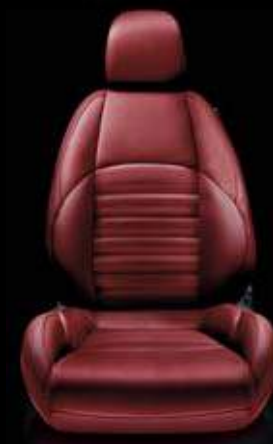
Leder 901 Rot (Option)