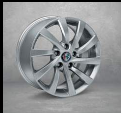
431 16" Turbina Aluminium Felgen mit 205/55 Bereifung