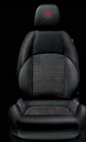
Stoff/Alcantara® 308 Schwarz/Grau (Serie)