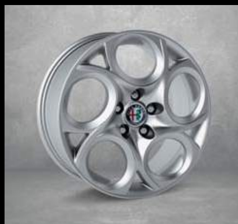
5YN** 17" 5-Loch Aluminium Felgen mit 225/45 Bereifung