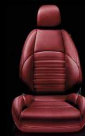
Leder 401 Rot (Option)