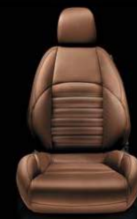
Leder 465 Tabacco (Option)